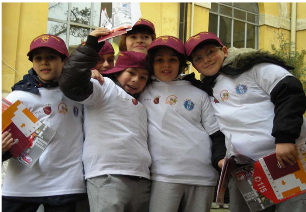
I Bambini al termine delle attività di gioco